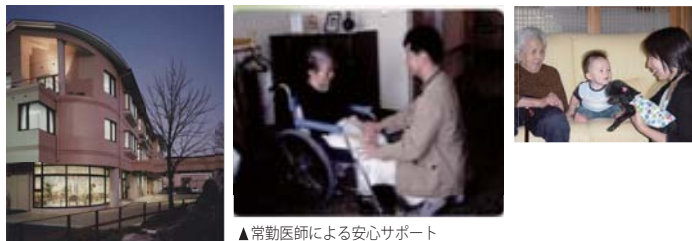
▲常勤医師による安心サポート